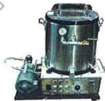
250型セパレート式真空脱泡ミキスタ