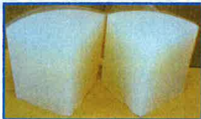
完全な混合と気泡のない仕上がり