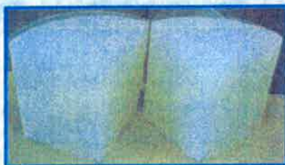
完全な混合と気泡のない仕上がり